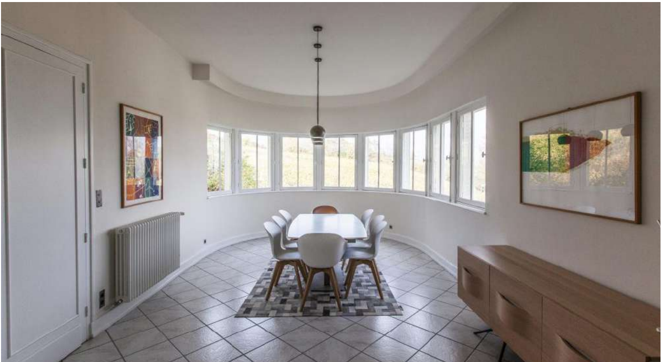
La Villa Sabourin

Comme vu précédemment, l'architecte peut proposer un binôme, en ayant connaissance des conditions proposées et des contraintes.