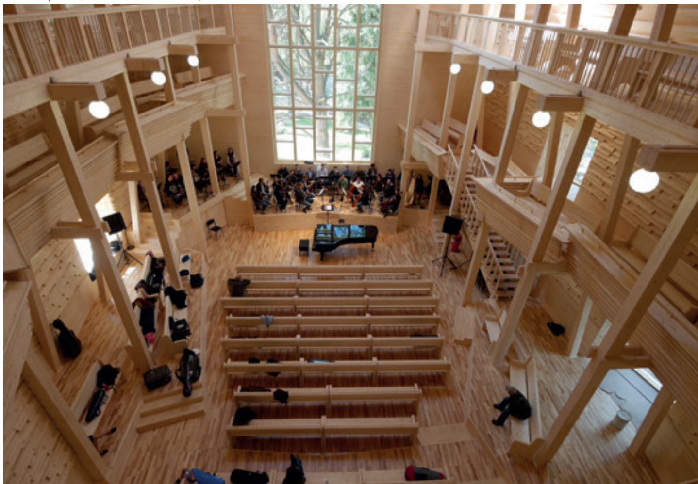
Mention au palmarès du Grand Prix AFEX 2018 - Salon de musique - Repino - Saint-Petersbourg (Russie) Fabre & Speller

L'examen du projet de loi par le Sénat en séance publique se tient du 16 au 24 juillet. A cette occasion, le collectif Ambition Logement a appelé à manifester contre le projet de loi le 17 juillet afin d'inciter les sénateurs à poursuivre et amplifier leur travail d'amendements du texte.