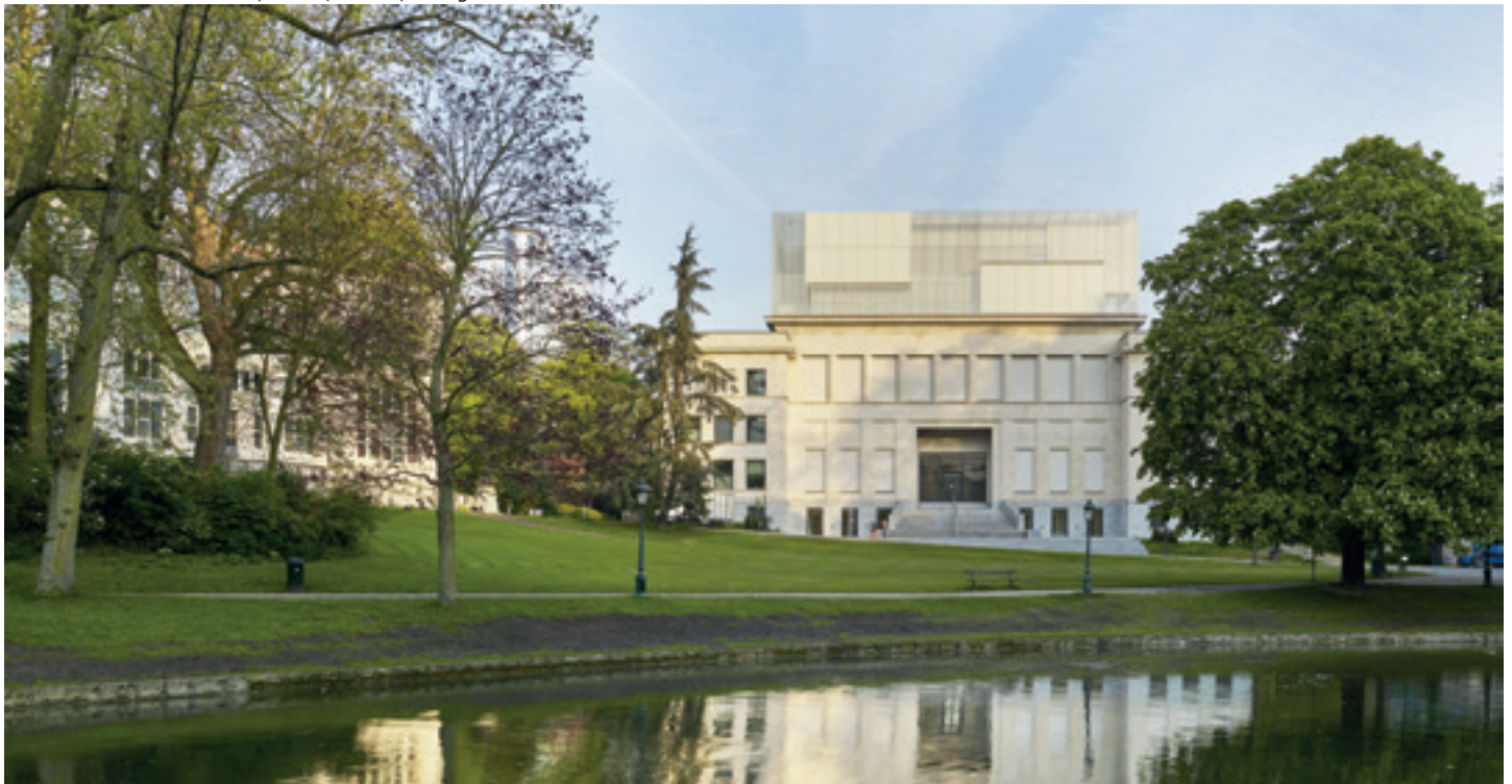
Mention au palmarès du Grand Prix AFEX 2018 - Maison de l'Histoire Européenne - Bruxelles (Belgique) Chaix & Morel et Associés, Paris / JSWD, Cologne

Retrouvez le collectif sur ambitionlogement.org