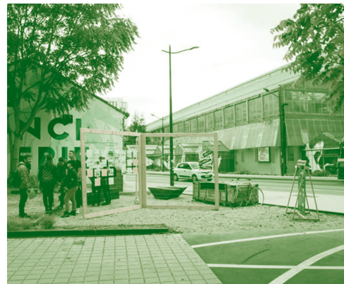
Les multiples facettes du métier d'architecte

L'ordre est ce que nous, architectes, décidons d'en faire entre les marges étroites des cadres légaux et réglementaires.