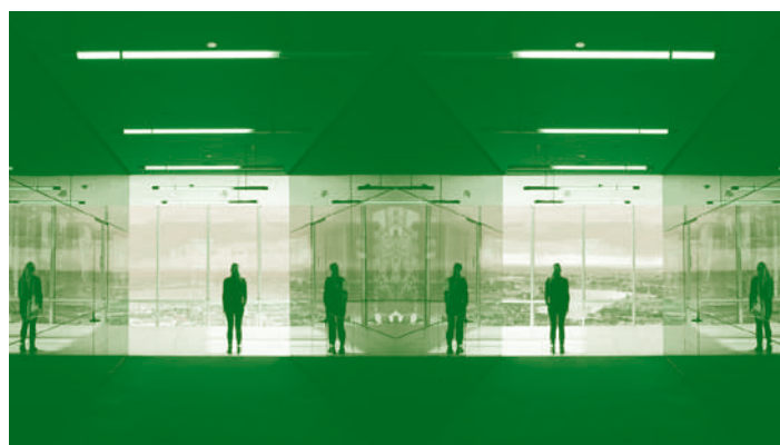
Face Face complet

Par Benoît, Frédéric, Pierre-Yves, Thomas, Wilfrid le 15 novembre 2017 — Montréal, Nantes.