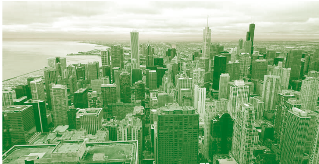
Le loop Chicago

Nous l'avons suivi sur les routes de cette ville à grande échelle avant de retourner en France, nourris et encore rêveurs de ce voyage.