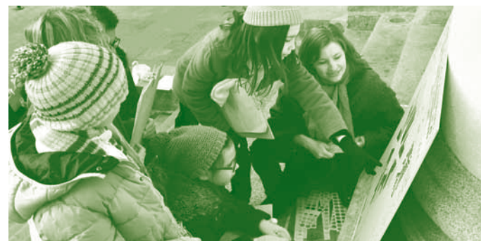
École Chêne d'Aron, Nantes

Les problématiques soulevées par l'élaboration de la carte président à la fabrication d'un programme d'un petit équipement public. Disposant d'éléments préfabriqués, les élèves lui ont donnée une matérialité. C'est la clé de compréhension du travail de l'architecte qui, par sa lecture du territoire, propose une réponse plastique et sensible. Les résultats, exposés de manière collective, nous ont surtout montré comment la ville et l'architecture donnent les outils d'une citoyenneté partagée.