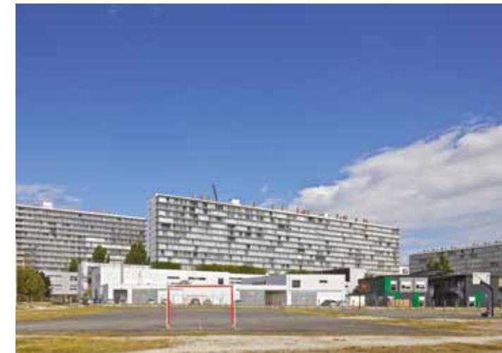
Immeubles G, H, I, Quartier du Grand Parc, Bordeaux, France Architectes : Anne Lacaton & Jean-Philippe Vassal, Frédéric Druot, Christophe Hutin