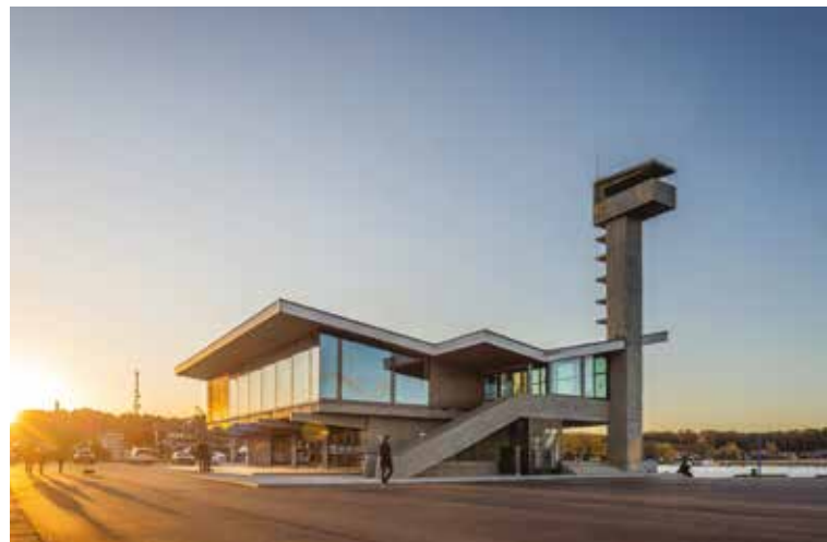
Reconstruction du quai de Nida, Nida, Lituanie Architecte : UAB LG Projektai et UAB GAL Architektai, G.Vieversys, A.Šablevičius, E.Buikaitė