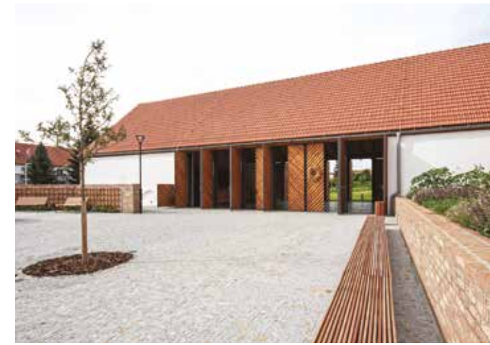
Centre communautaire de Židlochovice Židlochovice, République tchèque Architecte : Pavel Jura, Pavel Steuer / Jura et Consortes