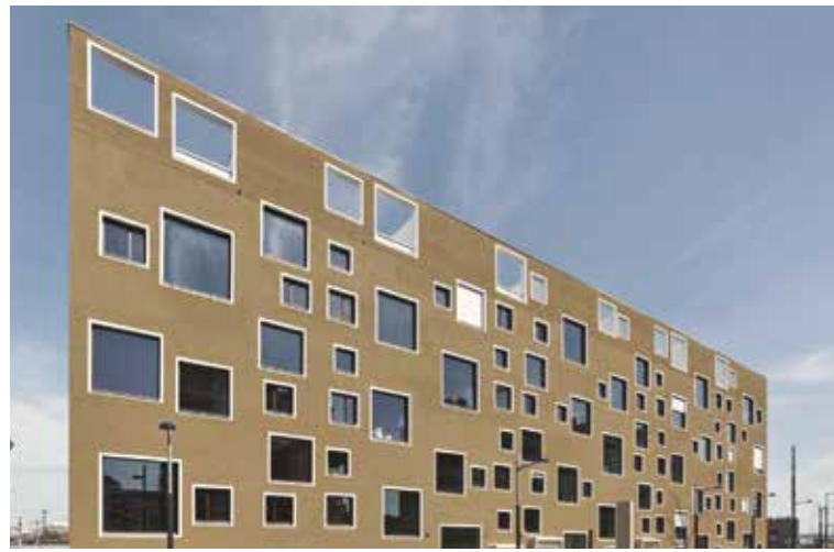
Atelierhaus C.21 Vienne, Autriche Architecte : Werner Neuwirth Collaborateurs : Architecte : gaban büllingen / Project management: robert hahn / Paysagiste : Isolde Rajek