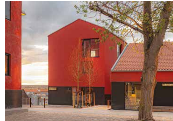
La Malterie, Ebeltoft, Danemark Architecte : Praksis Partenaires : VMB Restaurering, Kristine Jensen Landskab, Henry Jensen Ingeniører