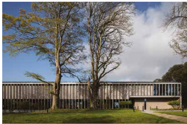
Le club de Padel, Adare, Co.Limerick, Irlande Architecte : Healy Partners