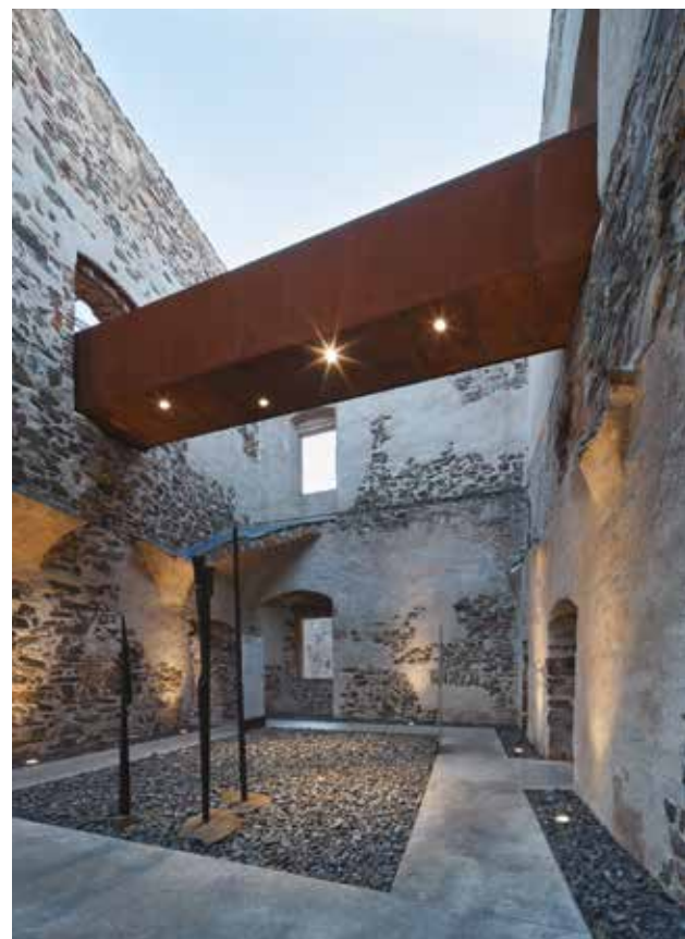
Reconstruction du château de Helfstýn, Týn nad Bečvou, République tchèque Architectes : Miroslav Pospíšil, Martin Karlik/ atelier-r3

“Je voudrais souligner le rôle du Conseil des Architectes d'Europe (CAE), qui a vraiment renforcé la dimension culturelle de ses activités avec notre soutien au cours des dernières années, qu'il s'agisse de concours d'architecture ou de la réaffectation du patrimoine bâti. Il a, d'une certaine manière, préparé un terrain commun, en référence au titre de cette conférence, à une meilleure reconnaissance de la contribution de la culture à un environnement bâti de qualité, durable et inclusif. Nous sommes vraiment heureux d'accompagner ce processus”.