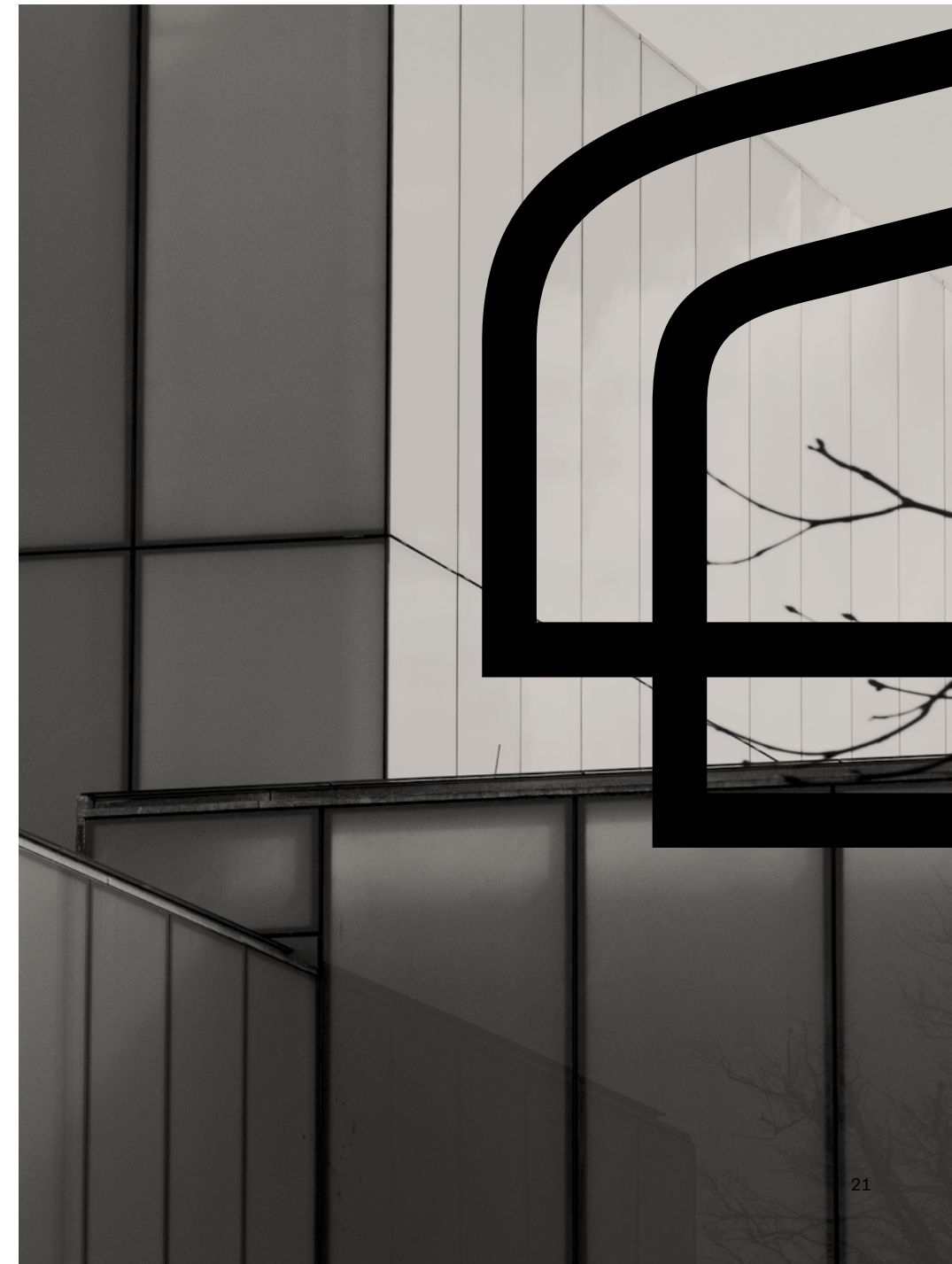
Conversion de cantines - Faculté des sciences humaines Université Charles, Prague, Czechia Architecte : Kuba & Pilař