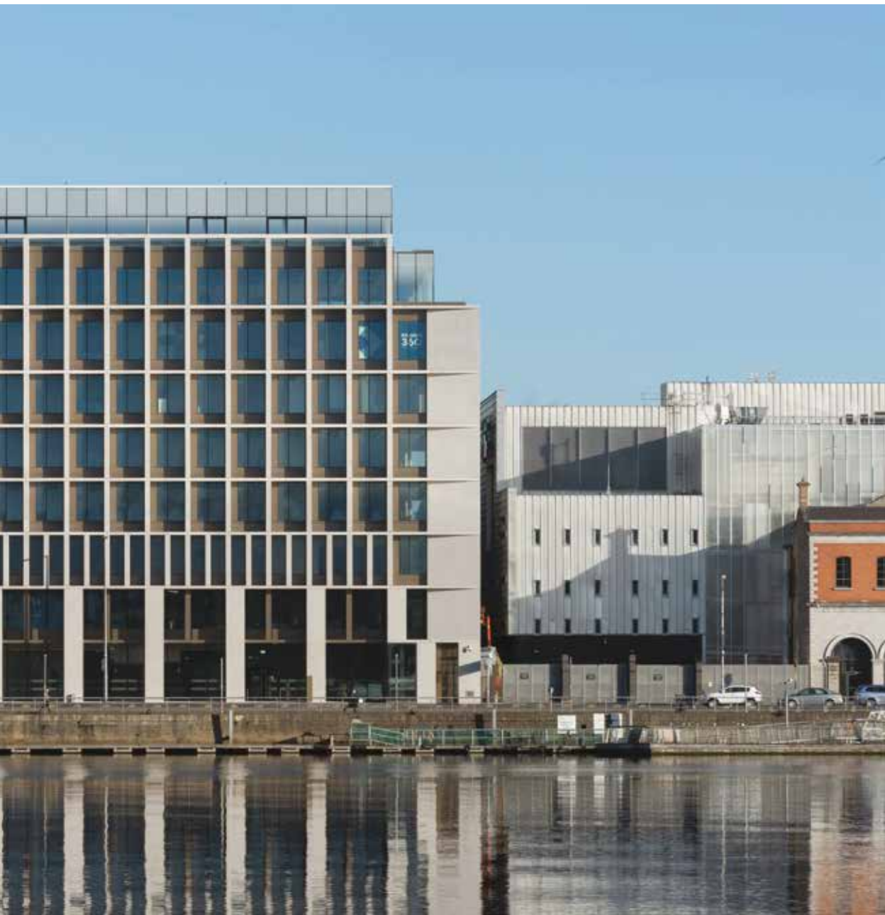
North Dock, Dublin, Irlande Architecte : ABK Architects