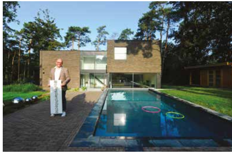
#Quiestlaarchitecte Campagne de sensibilisation de l'OA sur la profession d'architecte, Belgique - Y Jehoulet