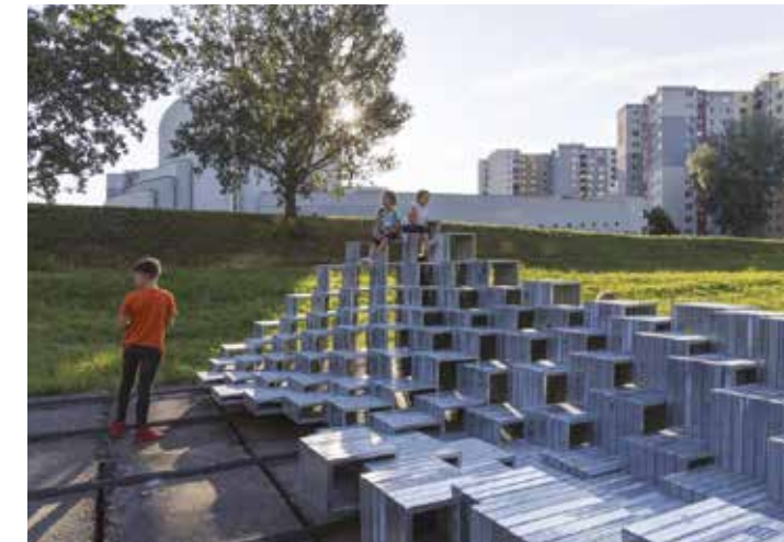
Mo(nu)ments informels, Bratislava-Petržalka, Slovaquie collectif d'auteurs : Académie des Beaux-Arts et du Arts et du Design (2020)