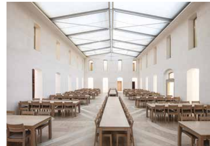
Académie de musique bavaroise, Hammelburg, Allemagne Architectes : Brückner & Brückner Architekten