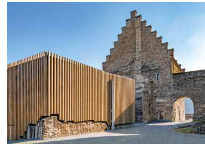
Château de Bourscheid - Annexe, Luxembourg Becker Architecture & Urbanisme