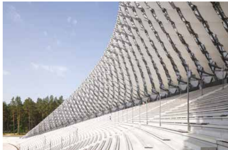
Reconstruction du kiosque à musique du festival de la chanson, Mezaparks, Lettonie Architecte : Austris Mailitis, Juris Poga