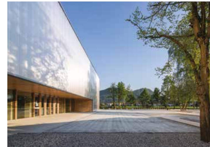
Gymnase de l'école primaire, Ljubljana, Slovénie Architecte : Medprostor