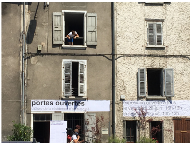
Un nouveau regard sur le centre bourg, St Marcellin 2019