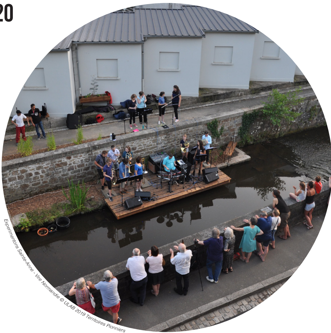
Experimentons Sainte-Anne - Vire Normandie