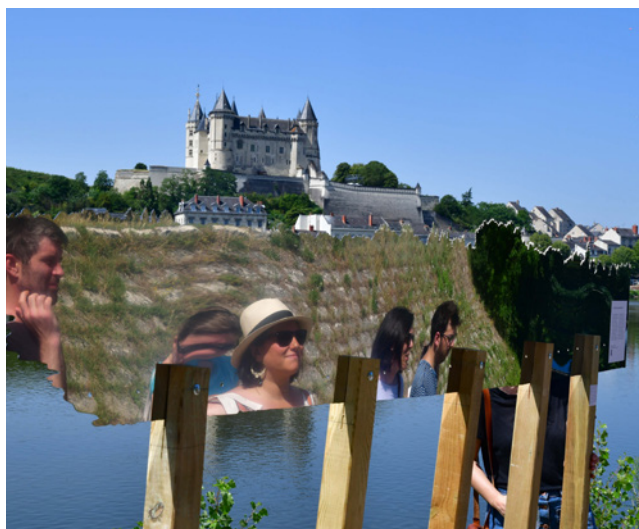
Reveler la ville#7 Rever l'île, Saumur, 2019, Ardepa

Le Réseau des maisons de l'architecture relayera l'actualité des résidences en cours sur ses réseaux sociaux.