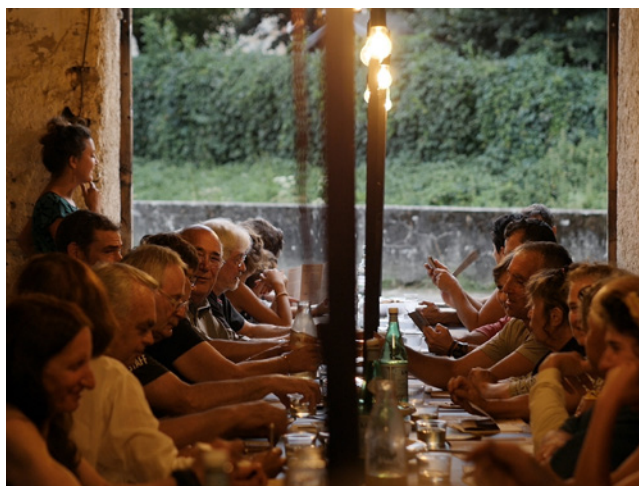
Qu'est-ce-que l'on fait ce soir ? Arbas, 2019