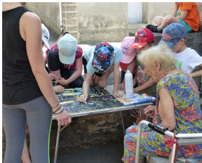
L'office de l'Utopie, Montbozon 2019

Afin de permettre à tous de suivre le déroulement des résidences, chaque binôme créera et alimentera un site/blog dédié à la résidence et produira un support de synthèse présentant leur démarche et leurs réalisations.