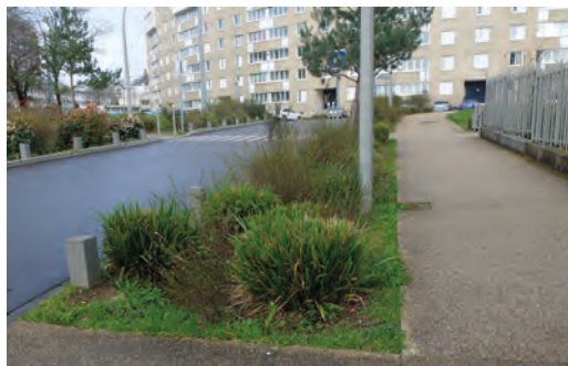
Quartier du Val de l'Aurence Sud.