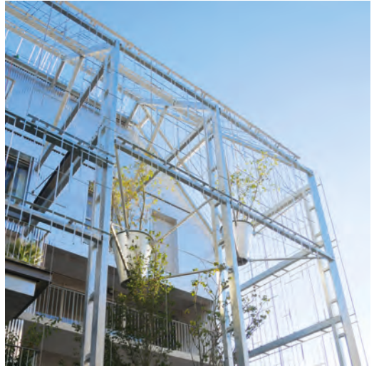
Maitrise d'ouvrage : Groupe Launay Équipe Maitrise d'œuvre : Duncan Lewis, architecte Terrell BET structure/enveloppe - Overdrive Economie, BET Fluides - FBC : HOE.

Nous construisons avec la nature pour reconnecter l'homme avec son environnement.