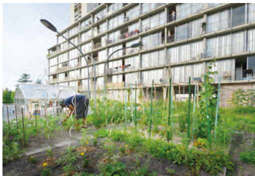
Locus Solus. Projet participatif en locatif social Maîtrise d'ouvrage : Aquitanis. Maîtrise d'œuvre : Éo, toutes architectures.