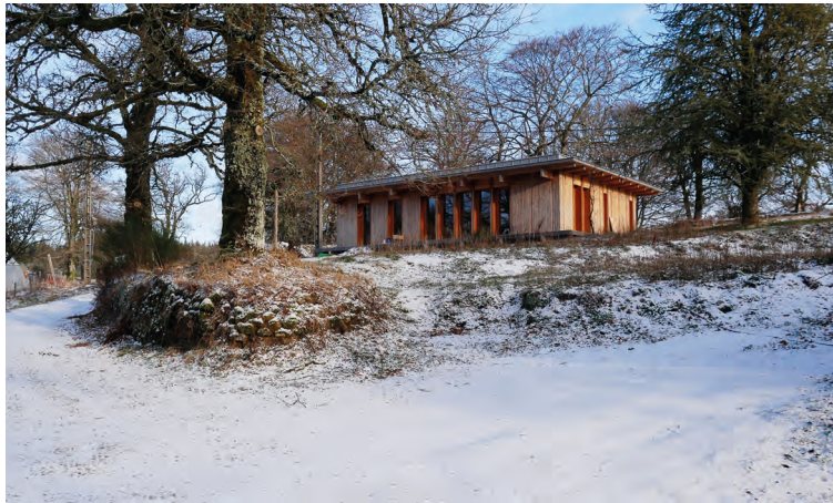
Les Monédières – Atelier du Rouget / Simon Teyssou & Associés Chaumell, Corrèze Mention S 2019