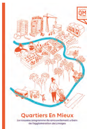
Brochure Quartier en Mieux.

Construire la ville durable dans les grands ensembles c'est aussi renouer avec cette utopie délaissée issue de la Charte d'Athènes : améliorer le cadre de vie tant au niveau social qu'environnemental — renouer avec le vivre ensemble, le progrès social pour tous et avec la Nature.