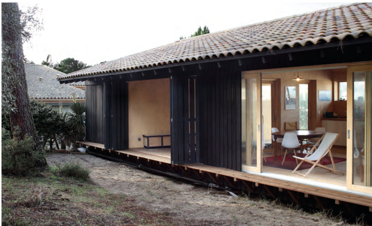
La maison du lac – Arthur Perbet Hourtin, Gironde Mention S 2019