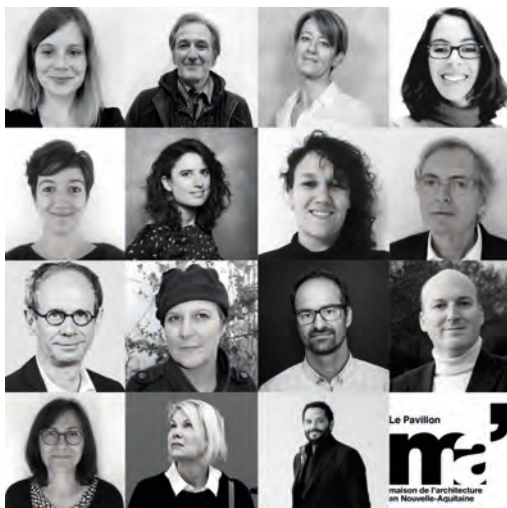
Conseil d'administration 2021-2024, de gauche à droite.

Autant d'idées qui fourmillent et ne demandent qu'à être concrétisées !