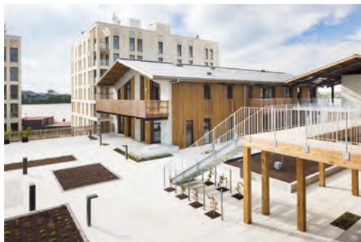
Le Jardin Suspendu, 20 logements participatifs à Bordeaux.