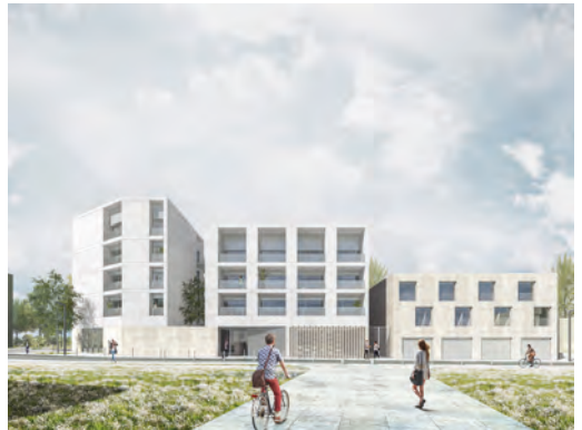
Résidence Inoui, 27 logements collectifs à Bordeaux.