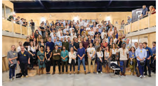
Archipride 2021 à la Fabrique Pola.

C'est une chance d'avoir au sein de notre métier cette diversité, il s'agit de la reconnaître, de s'en enrichir et de travailler toutes et tous ensemble.