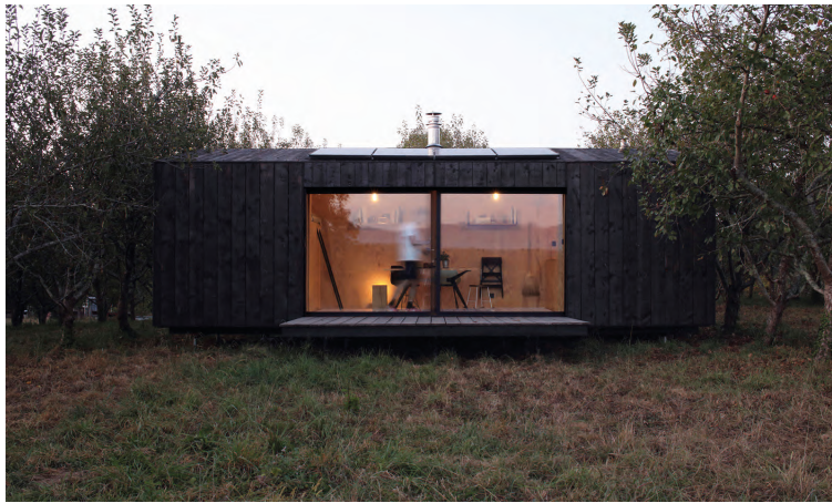
HIEVA – A6A Ustarritz, Pyrénées-Atlantiques Mention S 2019 – Laureats AJAP 2020