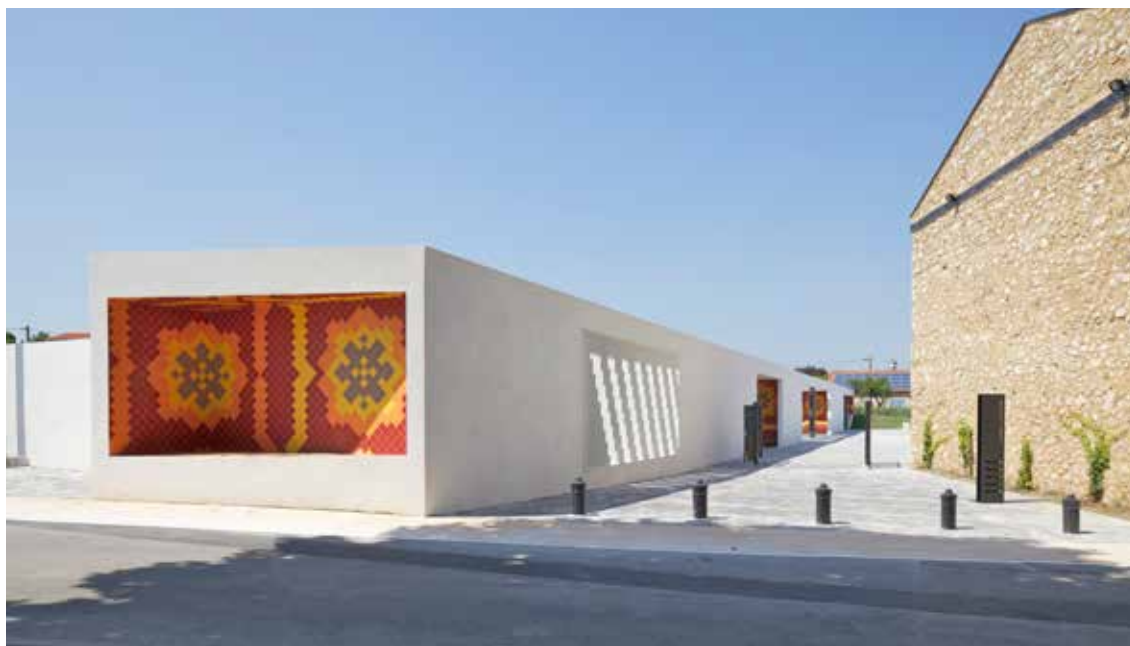
Aménagement urbain du centre-ville de Gignac La Nerthe (13), 2013, Comac Architectes