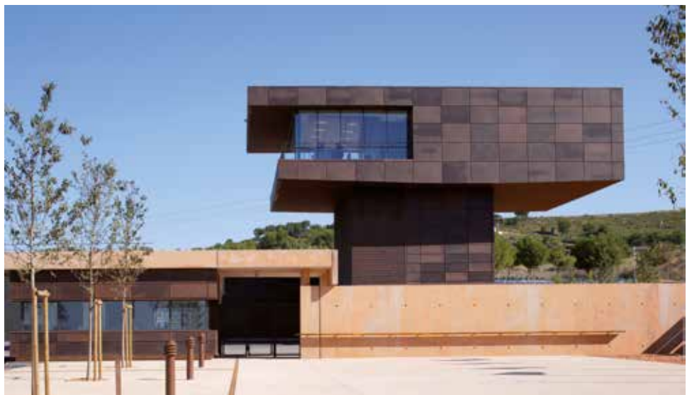
Plateau technique de l'Ecole nationale des officiers de sapeurs pompiers, Vitrolles (13), 2008, CCD Architecture