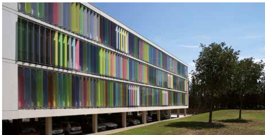
Hôtel communautaire du Grand Avignon (84), 2007, Jacques Fradin & Jean-Michel Weck arch. associés