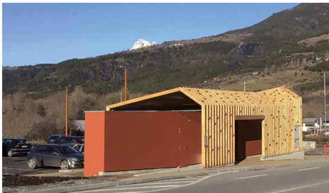
Aire multiservice rond-point sud, Baratier (05), 2014, Atelier Marie Garçin & Gilles Coromp arch. © architectes