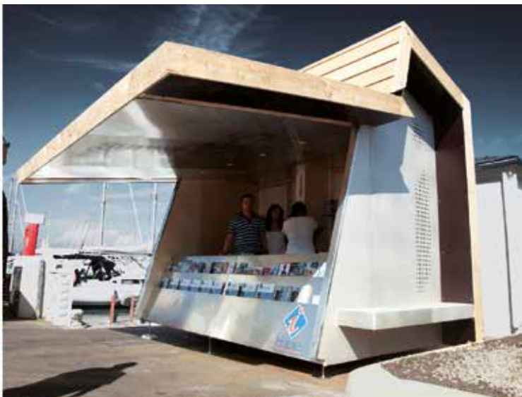
Kiosque d'information touristique (architecture mobile), Hyères (83), 2011, Stéphane Flandrin Fest architecture, Jean-Luc Fugier Pan architecture, Samuel Stambul Fest architecture © architectes