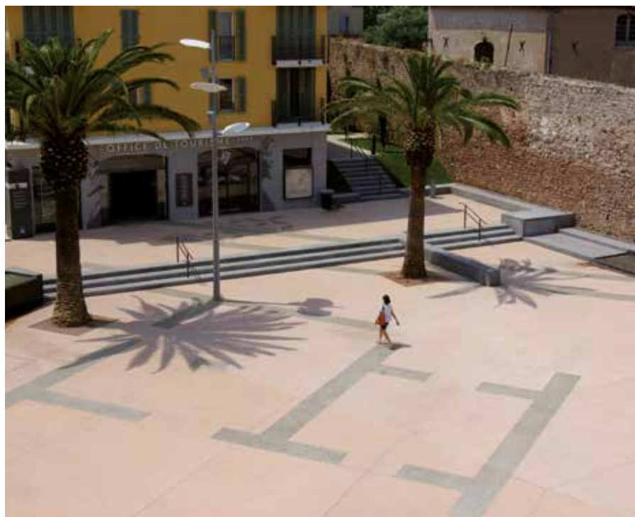
Place Clémenceau, aménagement de l'espace Mangin, Fréjus (83), Loïc Gestin arch.

Association Paritaire de Gestion du Paritarisme 8, rue du Chalet 75010 Paris Email : apgp.architecture@apgp.fr www.branche-architecture.fr