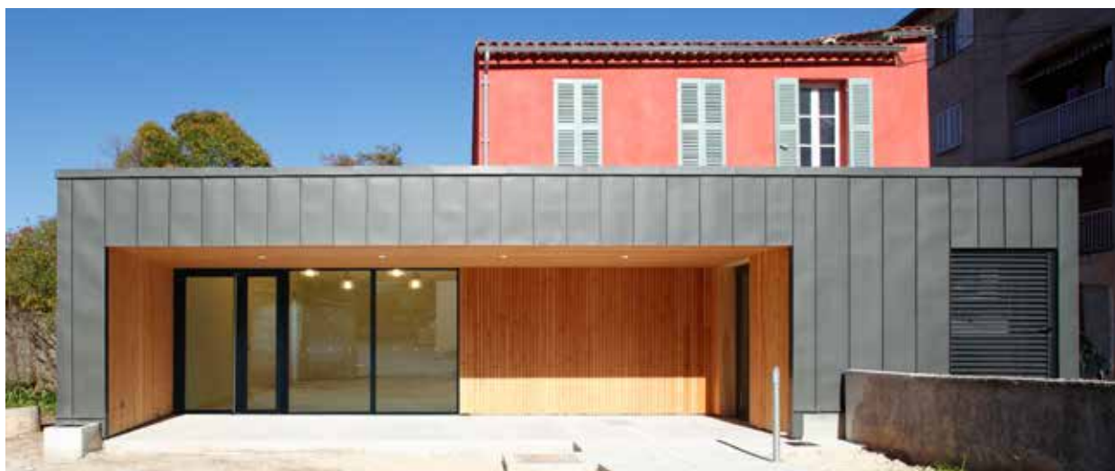
Maison des associations, Solliès-Pont (83), 2013, AAPL - Agence d'architecture Pascal Lestringant

Le permis d'aménager autorise la réalisation des constructions ou des démolitions ( article L.441-3 du code de l'urbanisme ).