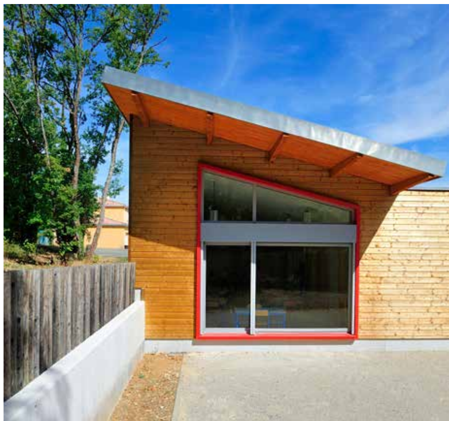
Extension d'école, Mison (04), 2012, Benoît Séjourné arch.

LES UNIVERSITÉS D'ÉTÉ DE L'ARCHITECTURE À MARSEILLE 2014