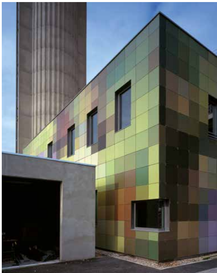
Extension du bloc technique et de la tour de contrôle, aéroport de Marseille-Provence (13), 2008, Corinne Chiche & Eric Dussol arch.