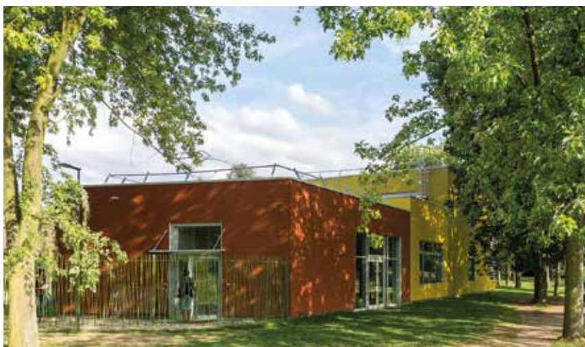
Centre de loisirs Pablo Neruda, Chevilly-Larue, Sylviane Saget architecte

22 Le marché est notifié et un avis d'attribution est publié dans un délai maximal de 30 jours à compter de la signature du marché (article 104 du décret 2016-360).