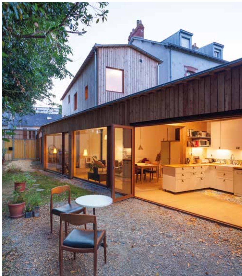
Maison neuve en ville, Nantes (44), 2015, MFA – Nathalie Ferré architecture

Pour soumissionner à la 3e édition du Prix Les Cubes d'Or de l'UIA Architecture & Enfants le dossier complet est à télécharger : www.architectes.org/actualites/3eme-edition-des-cubes-d-or-de-l-uia-architecture-enfants