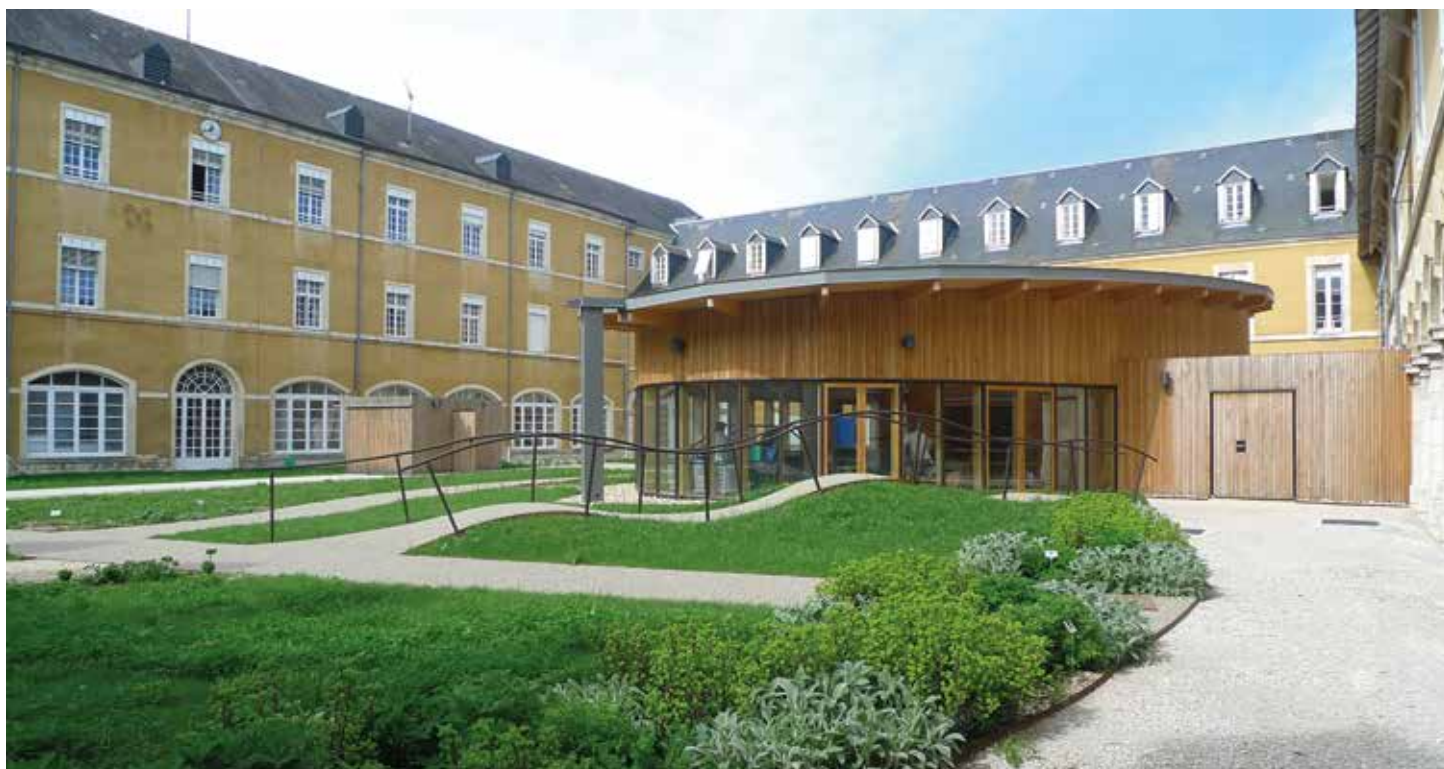
Plateau de rééducation, Montfaucon, Philippe Bergès-phBa architectes © architectes

Avant leur communication au jury, les enveloppes contenant les prestations sont ouvertes. Les prestations demandées sont enregistrées. Dans le cas où un élément distinctif est présent, le maître d'ouvrage veillera à rendre la prestation concernée anonyme.