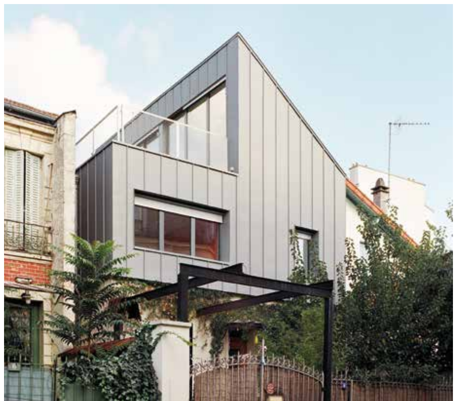
Surélévation d'une maison individuelle, Montreuil (93), 2015, Bauchet & de la Bouvrie arch.

Attention ! Le book de votre agence n'est complet et affiché sur « Architectes pour tous » que si vous avez mis en ligne au moins un projet. C'est essentiel pour que les maîtres d'ouvrage viennent vers vous (et plus vous avez de projets ajoutés, plus votre agence sera facile à trouver). Ne tardez pas ! Soyez présents vous aussi sur « Architectes pour tous », c'est gratuit et ne prend que quelques minutes ! ■